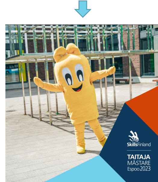
Taitaja-kulma 1080x1080 px

Suosi mielellään valkoista logoa. Tallenna muotoon .png