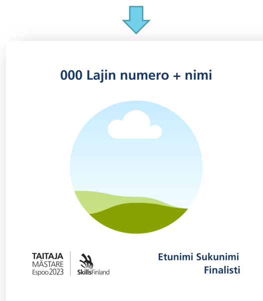
Yksinkertainen, lajin numero ja nimi sekä henkilön nimi