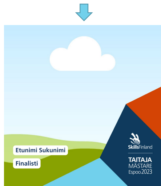
Taitaja-kulma nimellä 1080x1080 px