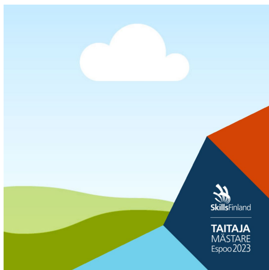
Taitaja-kulma 1080x1080 px, voi käyttää Photoshopissa